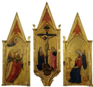
Bicci di Lorenzo