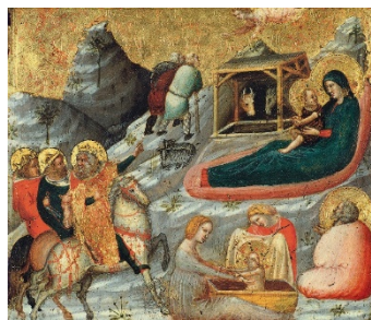
Pietro da Rimini

Colección Thyssen-Bornemisza, en depósito en el Museu Nacional d'Art de Catalunya (MNAC)