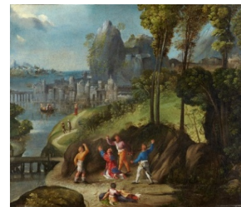
Dosso y Battista Dossi

Ferrara (?), 1490/1495-Ferrara, 1548 La lapidación de san Esteban , hacia 1525