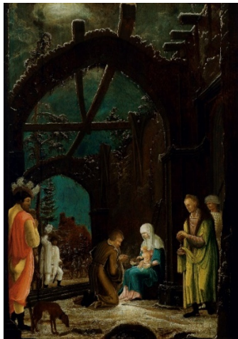
Maestro de la Adoración Thyssen

La adoración de los Reyes , hacia 1520 (The Adoration of the Magi) Óleo sobre tabla, 62 x 44,5 cm Colección Thyssen-Bornemisza, en depósito en el Museu Nacional d'Art de Catalunya (MNAC)